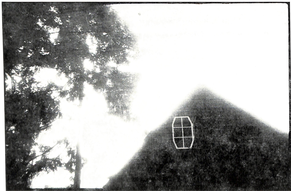
II nagrada — tema B Silvestar Kolbas »Moć dana«